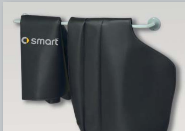
Настенный держатель (Арт. D-H 99)

Чистое и порядочное хранение боковых и передних чехлов, чехлов для сидений и чехлов из стекловолокна.