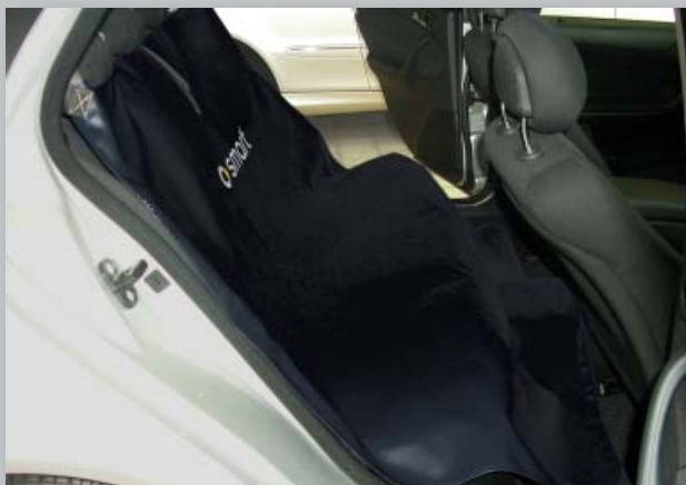
Чехол задней скамьи сидений smart (Арт. D-S 16 ST)

Из прочной черной искусственной кожи. Печать логотипа smart улучшает имидж мастерской. Крепится прочно и просто тканой лентой и присосками.