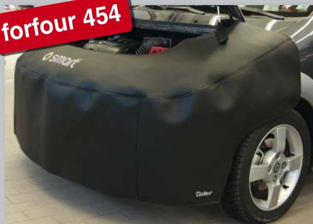
Переднее покрытие smart forfour 454 (Арт. D-ST 171)

Из прочной черной искусственной кожи покрытой пенорезиной. Печать логотипа smart улучшает имидж мастерской. Прикрепление без царапин, без магнитов.