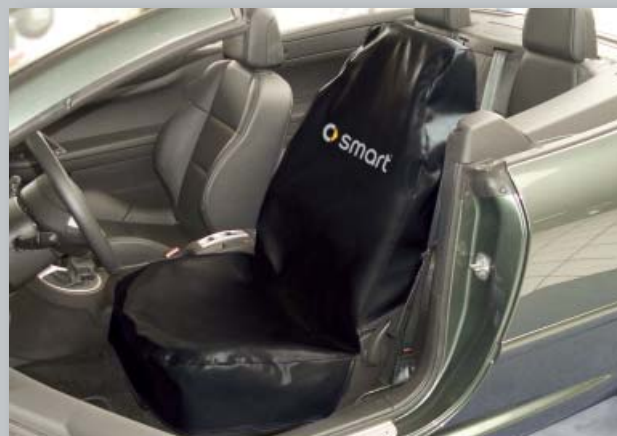
Чехол сиденья smart (Арт. D-S 15 ST)

Из прочной черной искусственной кожи. Печать логотипа smart улучшает имидж мастерской. Двойные швы, швы под растягивающим напряжением с упрочнением из искусственной кожи. Стирающийся при 30 °С.