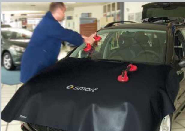
Защитный чехол на капот smart (Арт. D-ST 170-05)

Защитный чехол целого капота двигателя для ремонта ветрового стекла. Из прочной черной искусственной кожи покрытой пенорезиной. Печать логотипа smart улучшает имидж мастерской. Прикрепление без царапин, без магнитов.