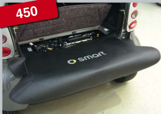
Задний чехол smart fortwo 450 (Арт. D-ST 170)

Из прочной черной искусственной кожи покрытой пенорезиной. Печать логотипа smart улучшает имидж мастерской. Прикрепление без царапин, без магнитов.