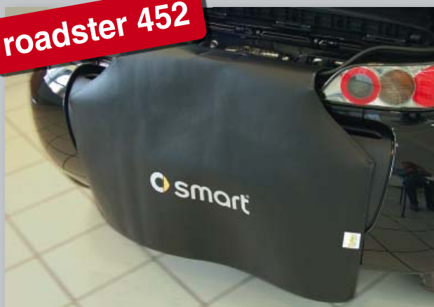
Задний чехол smart roadster 452 & roadster coupé 452 (Арт. D-ST 172)

Из прочной черной искусственной кожи покрытой пенорезиной. Печать логотипа smart улучшает имидж мастерской. Прикрепление без царапин, без магнитов.