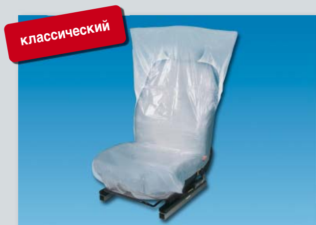
Чехол на сиденье «Classic»