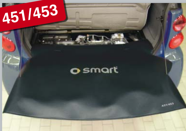
Задний чехол smart fortwo/forfour 451/453 (Арт. D-ST 174)

Из прочной черной искусственной кожи покрытой пенорезиной. Печать логотипа smart улучшает имидж мастерской. Прикрепление без царапин, без магнитов.