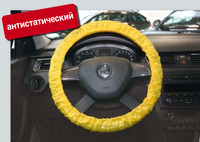
Чехлы для руля, "антистатические", (Арт. D-L 3100) для многократного использования

Защищают электронные устройства от электростатической разрядки. На резинке. Для пассажирских и грузовых автомобилей. Из особенно сильного полиэтилена, с компонентами антистатических материалов. Характерный желтый цвет. 20 шт. в коробке.