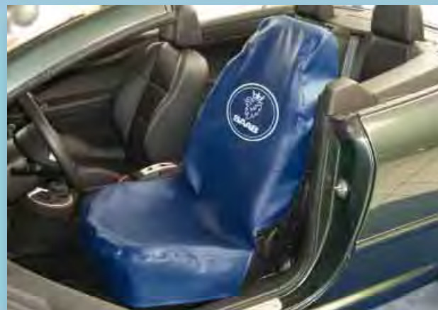
Чехол сиденья для Saab (Арт. D-S 15 SA)