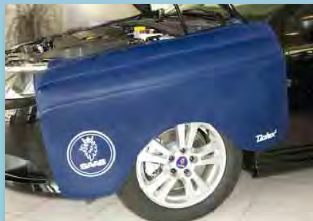
Накрыльные чехлы для марки Saab (Арт. D-S 80)

Для всех моделей. Из прочной синей искусственной кожи покрытой пенорезиной. Белая печать логотипа «Saab» улучшает имидж мастерской. Прикрепление без царапин, без магнитов. Размер: ± 260 x 67 см