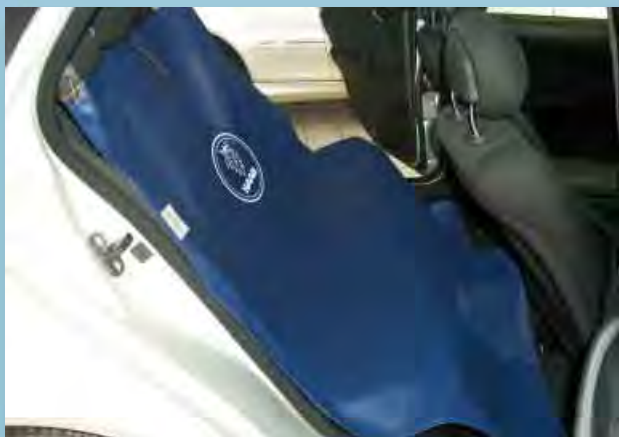
Чехол задней скамьи сидений для Saab (Арт. D-S 16 SA)