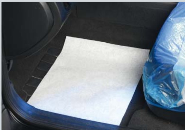
Защита для пола (Арт. D-T 26) из сильной креповой бумаги, размер: 370 x 500 мм, компакт-рулон по 500 шт.