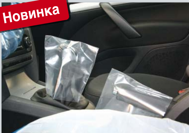
Одноразовый чехол на рычаг переключения передач и стояночный тормоз (Арт. D-SH 2020) из прозрачного полиэтилена, размер: 145 x 160 мм, коробка по 500 шт.