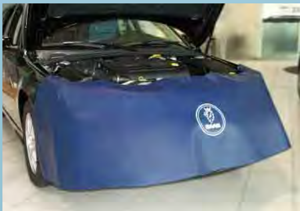
Передний чехол для марки Saab (Арт. D-S 80-01)

Для всех моделей. Из прочной синей искусственной кожи покрытой пенорезиной. Белая печать логотипа «Saab» улучшает имидж мастерской. Прикрепление без царапин, без магнитов. Размер: ± 260 x 67 см