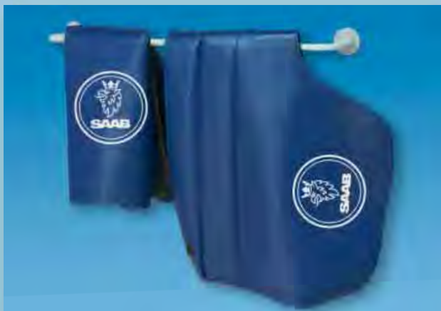
Настенный держатель (Арт. D-H 99)

Чистое и порядочное хранение боковых и передних чехлов, чехлов для сидений и чехлов из стекловолокна. Серая стальная труба. Включая крепежного материала.