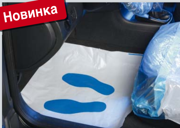
Защита для пола со следом стопы (Арт. D-T 95 F) из белого полиэтилена с печатью, на компакт-рулоне, размер: 550 x 610 мм, компакт-рулон по 500 шт.