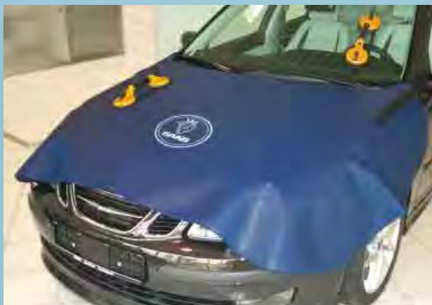
Защитный чехол на капот для марки Saab (Арт. D-S 80-05)

Для всех моделей. Из прочной синей искусственной кожи покрытой пенорезиной, с дополнительным упрочнением. Белая печать логотипа «Saab» улучшает имидж мастерской. Прикрепление без царапин, без магнитов. Размер: ± 113 x 69 см