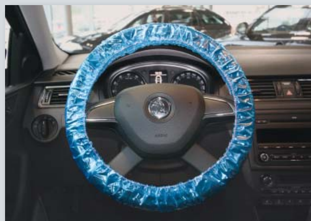
Чехлы для руля, (Арт. D-L 20) для многократного использования

на резинке, для пассажирских автомобилей, из особенно сильного полиэтилена, цвет: синий, 20 шт. в коробке.