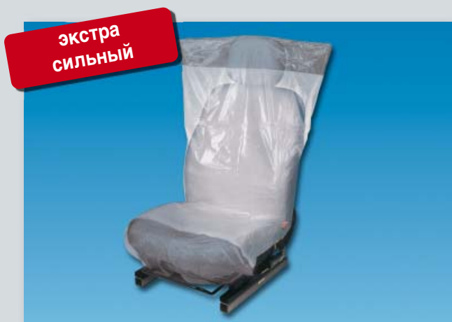
Чехол на сиденье «Optifit deluxe» (арт. D-E 2300)

Размер: прибл. 790 x 1330 мм Упаковка: 500 шт. на компакт-рулоне Вес: прибл. 11,0 кг