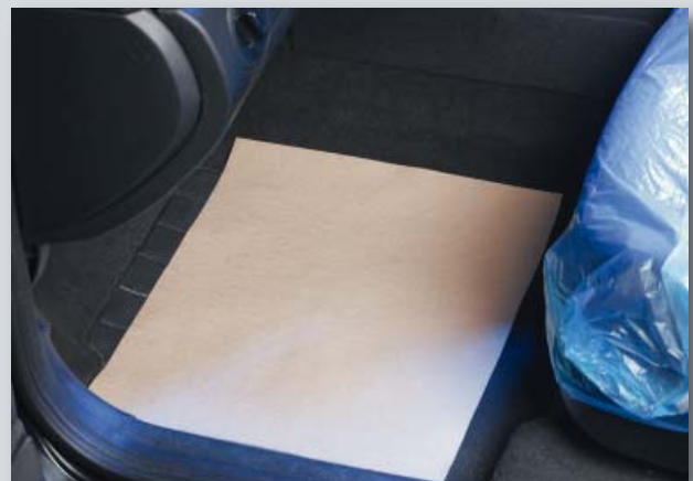
Защита для пола (арт. D-T 27)

из сильной креповой бумаги. Размер: прибл. 370 x 500 мм Упаковка: компакт-рулон по 500 шт. Вес: прибл. 7,1 кг