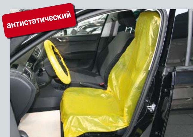
Чехол на сиденье «антистатический» (арт. D-E 3000)

Защищает электронные устройства от электростатической разрядки, для всех отдельных сидений, из особенно сильного полиэтилена, с компонентами антистатических материалов. Характерный желтый цвет.