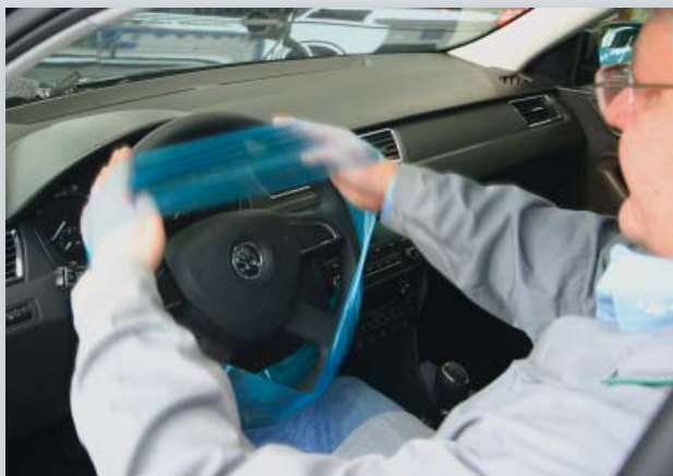
Чехлы для руля, для одноразового использования (арт. D-L 18)

Упаковка: 20 шт. в коробке. Вес: прибл. 0,6 кг