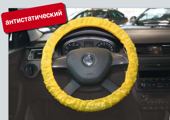
Чехлы для руля, "антистатические", для многократного использования (арт. D-L 3100)

Защищают электронные устройства от электростатической разрядки. На резинке. Для пассажирских и грузовых автомобилей. Из особенно сильного полиэтилена, с компонентами антистатических материалов. Характерный желтый цвет.