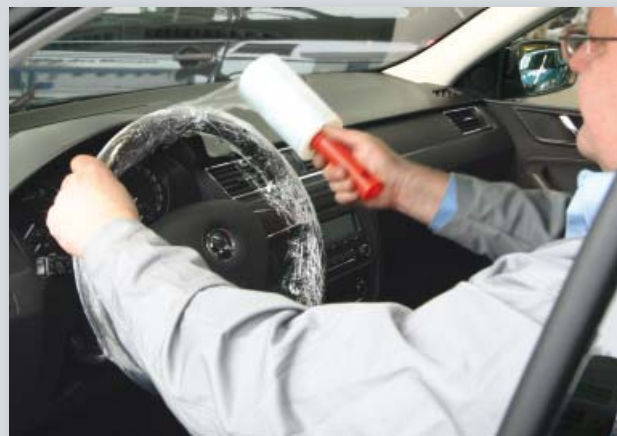
Чехол на руль и рычаг переключения передач, для одноразового использования (арт. D-L 42)

Упаковка: 500 шт. на рулоне Вес: прибл. 2,9 кг