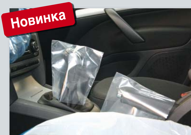
Одноразовый чехол на рычаг переключения передач и стояночный тормоз (арт. D-SH 2020)

из прозрачного полиэтилена. Размер: прибл. 145 x 160 мм Упаковка: 500 шт. на рулоне Вес: прибл. 2,5 кг