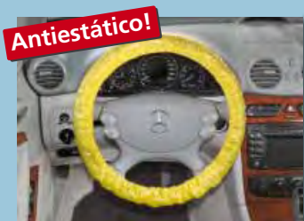
cobertura "antiestática" de volante com elástico, cor distintiva amarela ref. D-L 3100