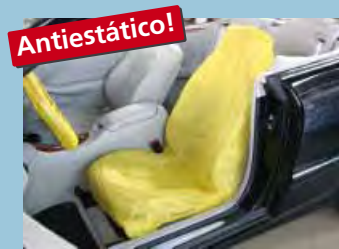
cobertura "antiestática" de assento cor distintiva amarela ref. D-E 3000