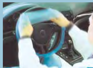
cobertura de volante em forma de anel, elástico, azul ref. D-L 18