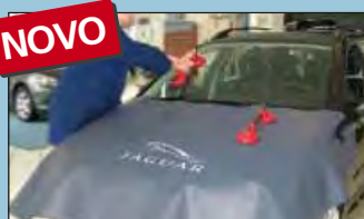
Cobertura da capota JAGUAR ref.: D-JA 140-05

Recomendado por los mayores fabricantes de automóviles.