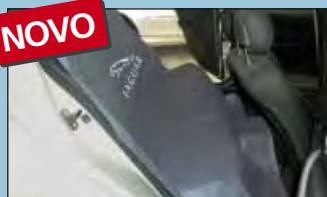
Proteção do banco traseiro JAGUAR ref.: D-S 16 JA

Recomendado por los mayores fabricantes de automóviles.