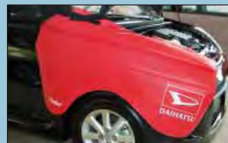
Cobertura de guarda-lama Daihatsu ref.: D-D 75