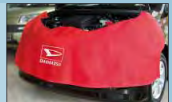
Cobertura dianteira Daihatsu ref.: D-D 75-01