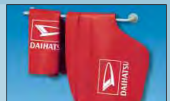
Suporte mural para manter ordem ref.: D-H 99