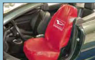
Cobertura de assento reutilizável Daihatsu ref.: D-S 15 DD