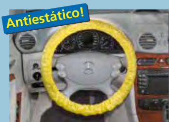
cobertura "antiestática" de volante com elástico, cor distintiva amarela ref. D-L 3100