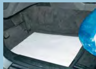
protetor do tapete papel: ref. D-T 26, ref. D-T 27 folha de polietileno: ref. D-T 95