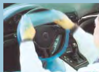
cobertura de volante em forma de anel, elástico, azul ref. D-L 18