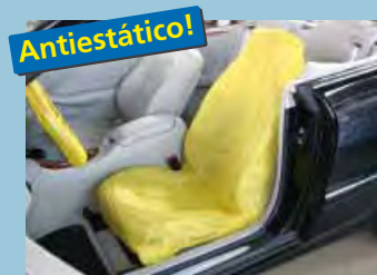
cobertura "antiestática" de assento cor distintiva amarela ref. D-E 3000