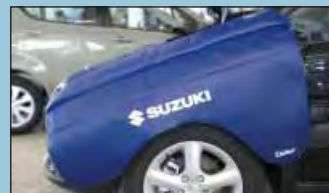
Kotflügelshoner SUZUKI Art.-Nr. D-Z 65