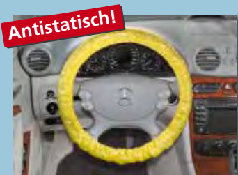
Lenkradschoner „antistatisch“ mit Gummizug in Signalfarbe „Gelb“ Art.-Nr. D-L 3100