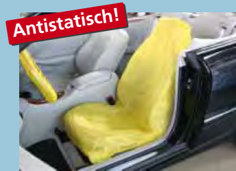
Sitzpolsterschoner „antistatisch“ in Signalfarbe „Gelb“ Art.-Nr. D-E 3000