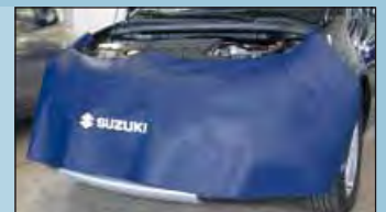
Frontabdeckung SUZUKI Art.-Nr. D-Z 65-01