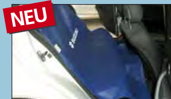
Werkstattschutz Rücksitzbank SUZUKI Art.-Nr. D-S 16 Z

Empfohlen von führenden Automobilherstellern