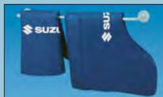
Der Wandbügel schafft Ordnung Art.-Nr. D-H 99