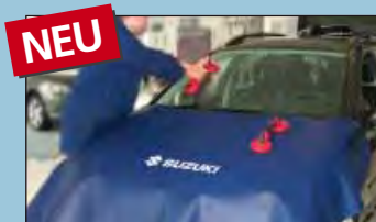
Motorhaubenschutz SUZUKI Art.-Nr. D-Z 65-05

Empfohlen von führenden Automobilherstellern