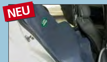
Werkstattschutz Rücksitzbank LANDROVER Art.-Nr. D-S 16 LR

Empfohlen von führenden Automobilherstellern