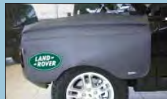
Kotflügelschoner LANDROVER Art.-Nr. D-LR 120