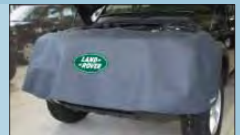
Frontabdeckung LANDROVER Art.-Nr. D-LR 120-01