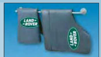
Der Wandbügel schafft Ordnung Art.-Nr. D-H 99