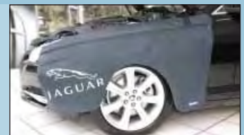
Kotflügelschoner JAGUAR Art.-Nr. D-JA 140