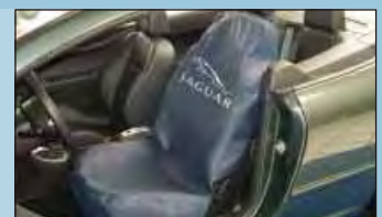
Langzeit-Sitzpolsterschoner JAGUAR Art.-Nr. D-S 15 JA