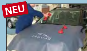
Motorhaubenschutz JAGUAR Art.-Nr. D-JA 140-05

Empfohlen von führenden Automobilherstellern