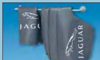
Der Wandbügel schafft Ordnung Art.-Nr. D-H 99