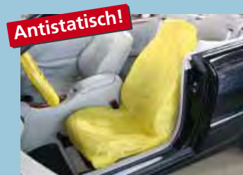
Sitzpolsterschoner „antistatisch“ in Signalfarbe „Gelb“ Art.-Nr. D-E 3000