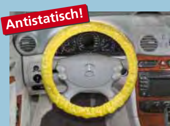
Lenkradschoner „antistatisch“ mit Gummizug in Signalfarbe „Gelb“ Art.-Nr. D-L 3100