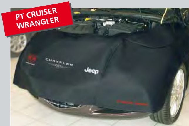
PT CRUISER WRANGLER

Special front and fender cover (O/N D-DG 220-01) Tailored for Dodge Caliber. Non-scratch attachment without magnets. Made of black foam-coated artificial leather, with coloured imprint of the logos and "CALIBER" to support the workshop's image.