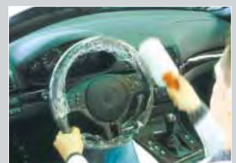
Lenkrad- & Schalthebelschutz

Ringform, flexibel in blau Art.-Nr. D-L 18