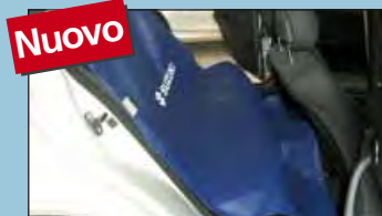
protezione della panca posteriore SUZUKI cod. D-S 16 Z

Raccomandati dalle principali case automobilistiche.