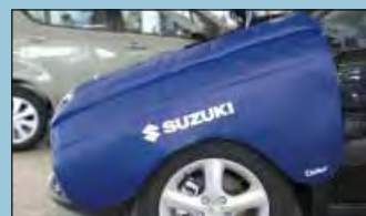
copri parafranghi SUZUKI cod. D-Z 65