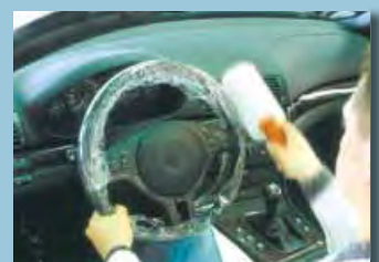
protezione del volante e della leva del cambio rotolo con foglio aderente, con impugnatura cod. D-L 42