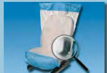
copri sedili "Optifit" non scivola, bianco e blu cod. D-E 2000