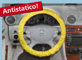
copri volante "antistatico" con filo di gomma; colore distintivo giallo cod. D-L 3100