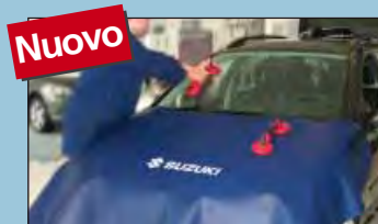
copertura del cofano SUZUKI cod. D-Z 65-05

Raccomandati dalle principali case automobilistiche.