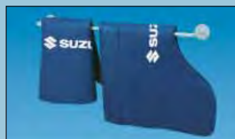
dispositivo murale per creare ordine cod. D-H 99