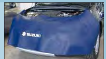
copertura frontale SUZUKI cod. D-Z 65-01