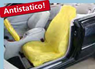
copri sedile "antistatico" colore distintivo giallo cod. D-E 3000