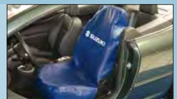
copri sedile SUZUKI cod. D-S 15 Z