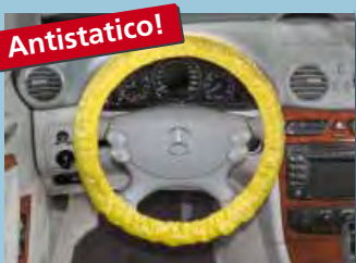
copri volante "antistatico" con filo di gomma; colore distintivo giallo cod. D-L 3100