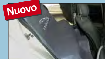
protezione della panca posteriore JAGUAR cod. D-S 16 JA

Raccomandati dalle principali case automobilistiche.