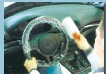
protezione del volante e della leva del cambio rotolo con foglio aderente, con impugnatura cod. D-L 42