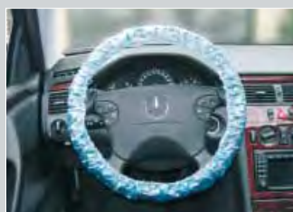
copri volante per autovetture, blu, con filo di gomma cod. D-L 20