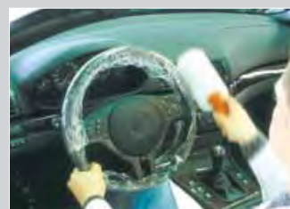
protezione del volante e della leva del cambio. Rotolo con foglio aderente, con impugnatura. cod. D-L 42