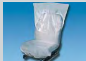
copri sedili "Classic tipo standard, bianco cod. D-E 35