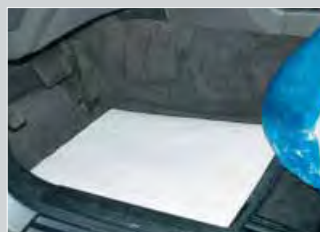
copri tappetino carta: cod. D-T 26, D-T 27 polietilene: cod. D-T 95