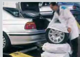
sacco porta pneumatici XXL: cod. D-R 156 XL: cod. D-R 155