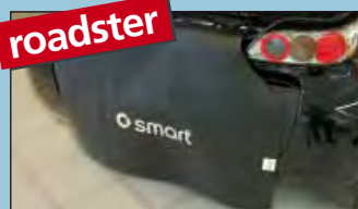
roadster housse de plage arrière smart roadster & roadster-coupé réf. D-ST 172