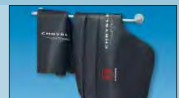
support mural créée de l'ordre réf. D-H 99