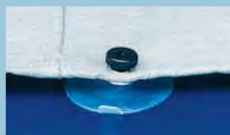
Fixation sans rayure par ventouses - facile à enlever et interchangeable.