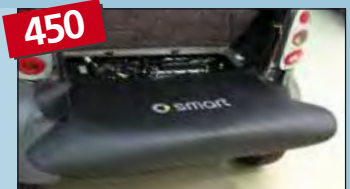
450 housse de plage arrière smart fortwo MC 01 / 450 réf. D-ST 170