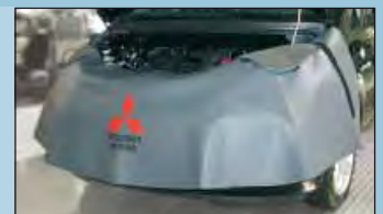
housses frontale Mitsubishi réf. D-MI 100-01