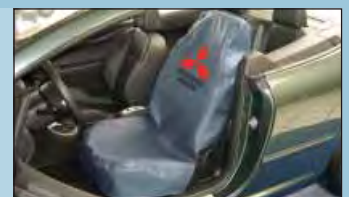
housses de siège Mitsubishi réf. D-S 15 MI