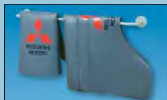
support mural crée de l'ordre réf. D-H 99