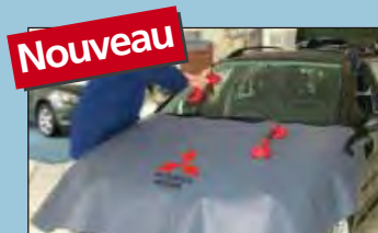
protection du capot Mitsubishi réf. D-MI 100-05