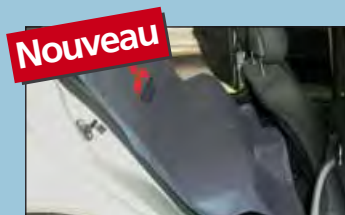
protection de la banquette arrière Mitsubishi réf. D-S 16 MI