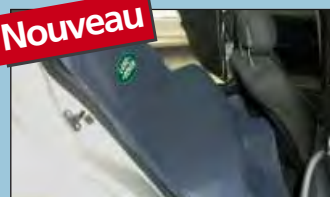
protection de la banquette arrière réf. D-S 16 LR

Recommandé par les principaux fabricants d'automobiles