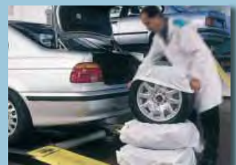
sac porte-pneus XXL: réf. D-R 156 XL: réf. D-R 155