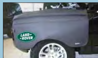
protège-ailes LANDROVER réf. D-LR 120