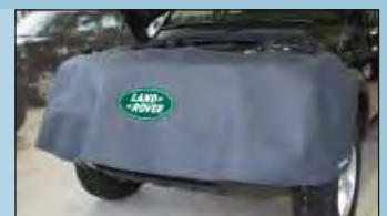
house frontale LANDROVER réf. D-LR 120-01