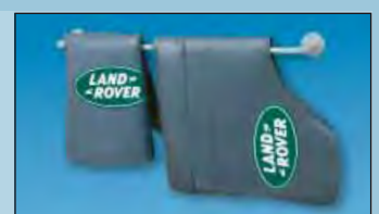
support mural crée de l'ordre réf. D-H 99