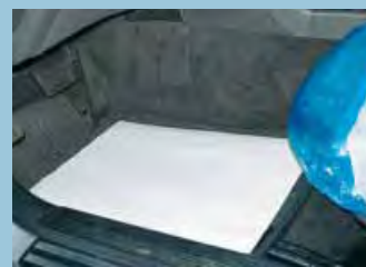
protège tapis papier: réf. D-T 26, D-T 27 feuille: réf. D-T 95

Pas de réparations chères et inutiles « Vous épargnez du temps et des frais »