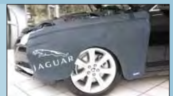
protège-ailes JAGUAR réf. D-JA 140