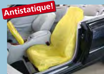
housse de siège « antistatique » couleur distinctive jaune réf. D-E 3000

Pas de réparations chères et inutiles « Vous épargnez du temps et des frais »