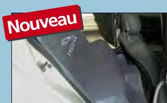
protection de la banquette arrière JAGUAR réf. D-S 16 JA

Recommandé par les principaux fabricants d'automobiles.