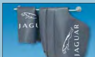
support mural crée de l'ordre réf. D-H 99