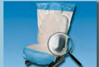
housse de siège « Optifit » dessous antidérapant, blanc et bleu réf. D-E 2000