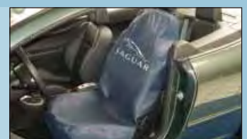
housse de siège JAGUAR réf. D-S 15 JA