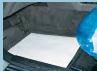
protège tapis papier: réf. D-T 26, D-T 27 feuille: réf. D-T 95