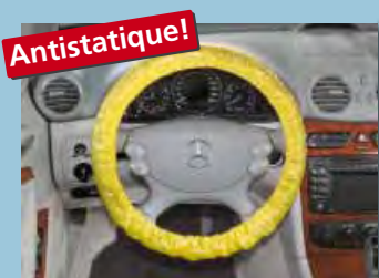
protège-volant « antistatique » fixation par élastique, couleur distinctive jaune réf. D-L 3100