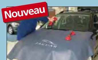
protection du capot JAGUAR réf. D-JA 140-05

Recommandé par les principaux fabricants d'automobiles.