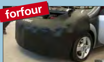
protector frontal y lateral smart forfour art. no. D-ST 171