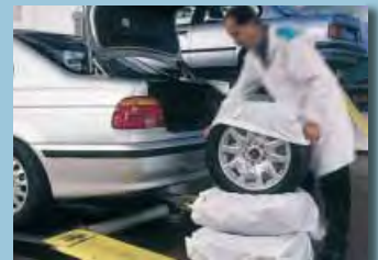
sacos porta neumáticos XXL: art. no. D-R 156 XL: art. no. D-R 155