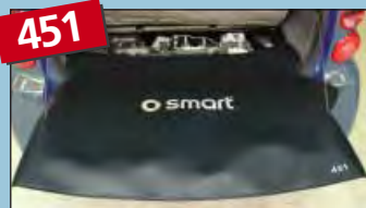
protector para la parte trasera smart fortwo 451 art. no. D-ST 174