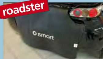
protector para la parte trasera smart roadster & roadster-coupé art. no. D-ST 172