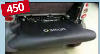
protector para la parte trasera smart fortwo MC 01 / 450 art. no. D-ST 170