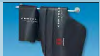
dispositivo mural para más orden art. no. D-H 99