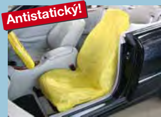
Potah na sedadla „antistatický“ žlutá rozlišovací barva Obj.č.: D-E 3000

Žádná drahá a zbytečná práce navíc „Ušetříte čas a peníze“