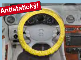
Potah na volant „antistatický“ s elastickou gumou, žlutá rozlišovací barva Obj.č.: D-L 3100