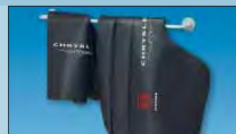
nástěnný držák pro pořádek a dostatek prostoru Obj. č.: D-H 99