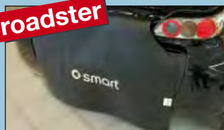
roadster zadní ochranný potah smart roadster & roadster-coupé Obj. č.: D-ST 172