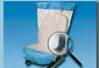
Ochranný potah na sedadlo „Optifit“ protiskuzová spodní strana, bílý a modrý Obj.č.: D-E 2000