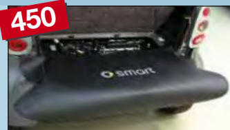
450 zadní ochranný potah smart fortwo MC 01 / 450 Obj. č.: D-ST 170