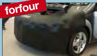
forfour přední ochranný potah smart forfour Obj. č.: D-ST 171