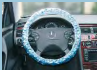
Ochranný potah na volant pro osobní automobily, modrý, s elastickou gumou Obj.č.: D-L 20