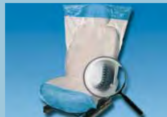
Ochranný potah na sedadlo „Optifit“ protiskuzová spodní strana, bílý a modrý Obj.č.: D-E 2000