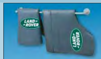
Nástěnný držák pro pořádek a dostatek prostoru Obj. č.: D-H 99