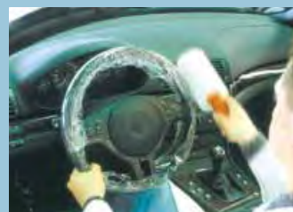
Ochrana volantu a řadicí páky adhesivní fólie s držadlem Obj.č.: D-L 42