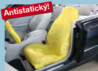
Potah na sedadla „antistatický“ žlutá rozlišovací barva Obj.č.: D-E 3000