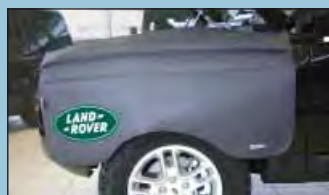
Postranní ochranný potah LANDROVER Obj. č.: D-LR 120