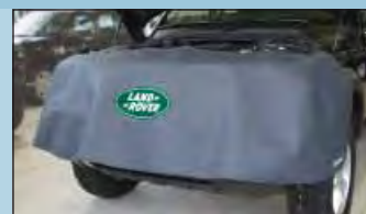
Přední ochranný potah LANDROVER Obj. č.: D-LR 120-01