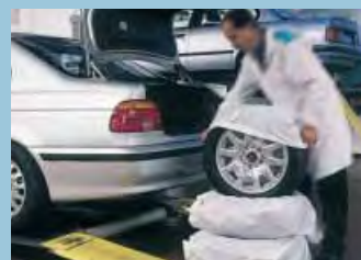
pneu pytle XXL: Obj.č.: D-R 156 XL: Obj.č.: D-R 155