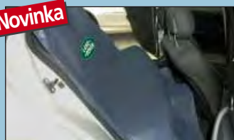
Ochrana zadní sedačkové lavice LANDROVER Obj. č.: D-S 16 LR