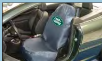
Ochrana sedadel LANDROVER Obj. č.: D-S 15 LR