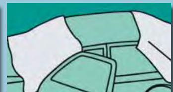
Ochrana oken (přísavné držáky) 1,00 m x 2,00 m Obj.č.: D-A 22