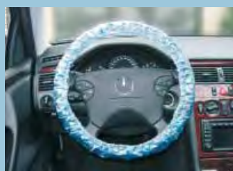
Ochranný potah na volant pro osobní automobily, modrý, s elastickou gumou Obj.č.: D-L 20