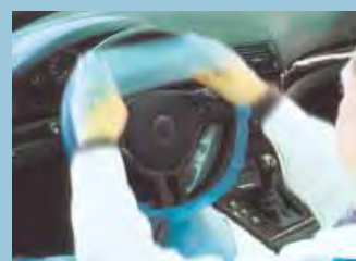
Ochranný potah na volant elastický, kruhový, modrý Obj.č.: D-L 18