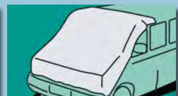
Standardní ochrana Velikost: 2,00 m x 2,00 m Obj.č.: D-A 21