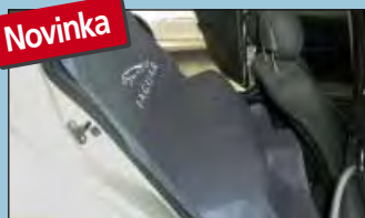
Ochrana zadní sedačkové lavice JAGUAR Obj. č.: D-S 16 JA