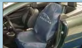
Ochrana sedadel JAGUAR Obj. č.: D-S 15 JA