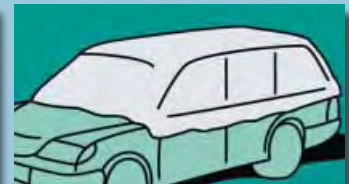
Celkové zakrytí chrání střešku a okna 4,40 m x 2,60 m Obj.č.: D-A 25-01