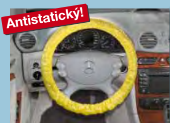
Potah na volant „antistatický“ s elastickou gumou, žlutá rozlišovací barva Obj.č.: D-L 3100