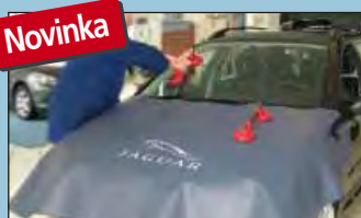
Ochranný potah pro kapotu JAGUAR Obj. č.: D-JA 140-05