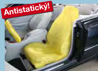
Potah na sedadla „antistatický“ žlutá rozlišovací barva Obj.č.: D-E 3000

Žádná drahá a zbytečná práce navíc „Ušetříte čas a peníze“