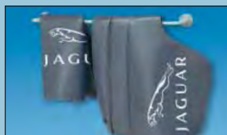
Nástěnný držák pro pořádek a dostatek prostoru Obj. č.: D-H 99