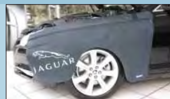
Postranní ochranný potah JAGUAR Obj. č.: D-JA 140