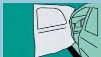
Ochrana dveří Velikost: 1,40 m x 1,30 m Obj.č.: D-A 23