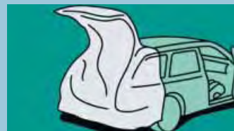
Speciální zakrytí pro vozy Kombi a minivany Obj.č.: D-A 25-02