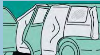
Ochrana interiéru (přísavné držáky) 2,40 m x 1,50 m Obj.č.: D-A 20